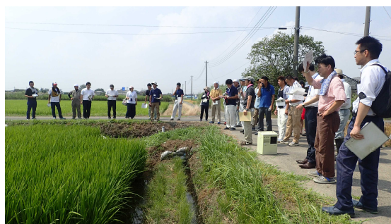
現地圃場検討会の様子