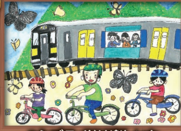
ハシゴライドは楽しいな