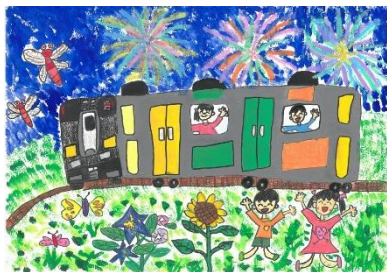
昨年の金賞受賞作品