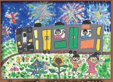
レッツゴー!ぼくらの水郡線