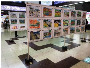
駅での展示の様子