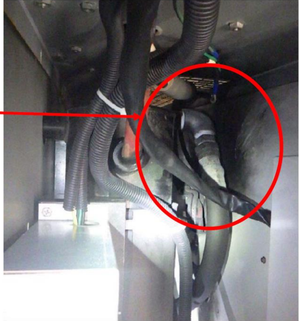
空気圧縮機内部（上部から見たところ）

空気圧縮機 寸法 cm：約 200(幅) × 約 150(高さ) × 約 73(奥行き)