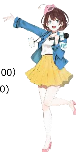
茨城県公認Vtuber 茨ひより