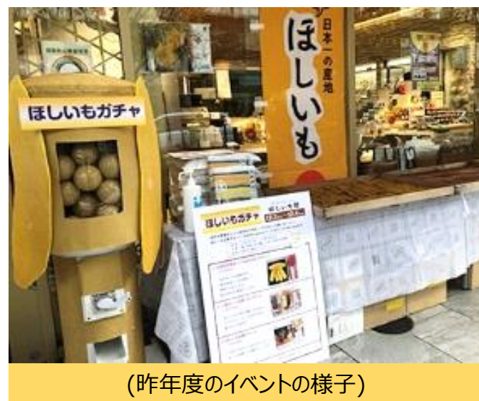
(昨年度のイベントの様子)