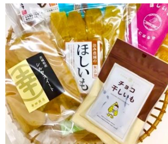
◀ほしいもセットイメージ