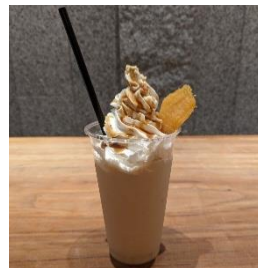
ほしいもシェイクイメージ