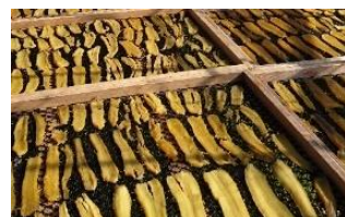
▼現地でのほしいも作りの様子