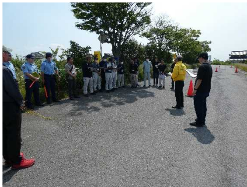
▲開催あいさつの様子