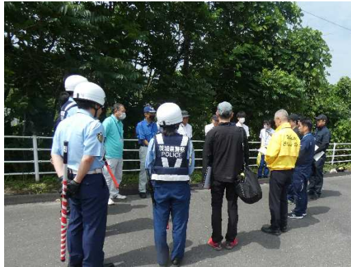
▲開催あいさつの様子