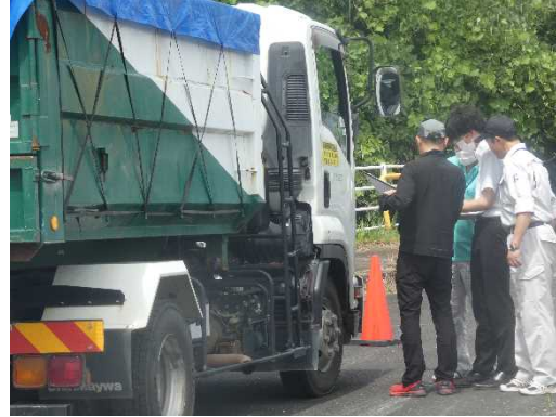
▲積み荷を確認する様子