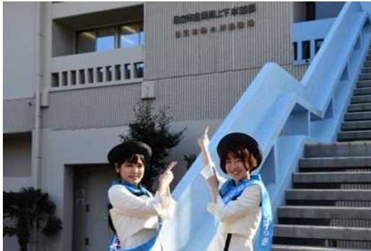
現場レポートの様子

国土交通省や日本下水道協会等が支援する「ミス日本 水の天使」(ミス日本コンテスト事務局主催)が、下水道の役割等を分かりやすく発信する役割を担っている事例に習い、茨城県に根差した下水道イメージアップ活動を行うことから「いばらき 水の天使」とした。