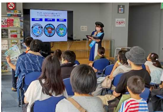
下水道講座の講師の様子