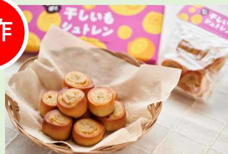
ぱくぱく干しいもシュトレン