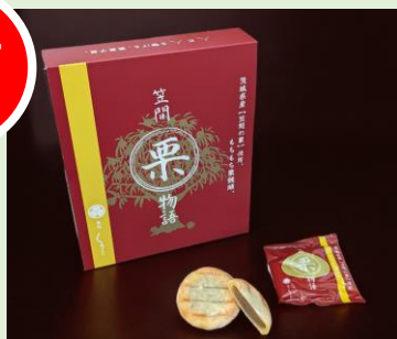
笠間栗物語 もちもち栗饅頭