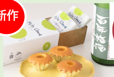
水戸梅マドレーヌ