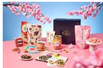
▲おみやげボックス(イメージ)