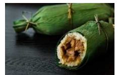
▲笹巻ごはん (日立駅)