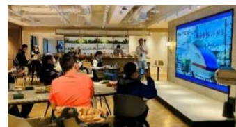
▲One&Co Taipei でのイベント(イメージ)