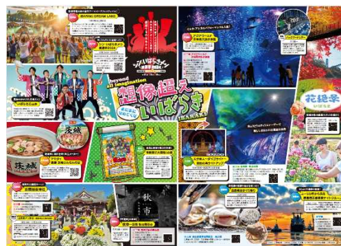
▲茨城アフターDC 特集ページ