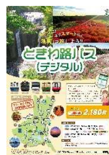
▲「ときわ路パス(デジタル)」 ポスター