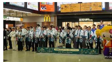
▲昨年の茨城DCの様子(セレモニー)