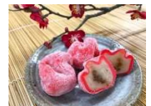
▲水戸梅小町 (水戸駅)