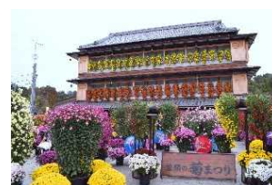
▲笠間の菊まつり(笠間市)