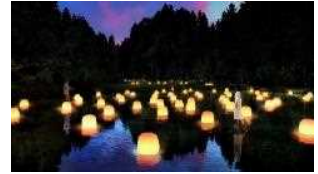
チームラボ「チームラボ 幽谷隠田跡」五浦 © チームラボ