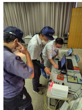
治具を用いた省力化 SNSを用いた異常通知 実演展示の様子