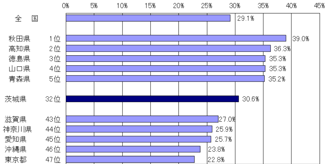
図 3 都道府県別 高齢者の割合（令和 5 年 10 月 1 日現在）

注) 総務省統計局「人口推計（2023 年（令和 5 年）10 月 1 日現在）」より作成