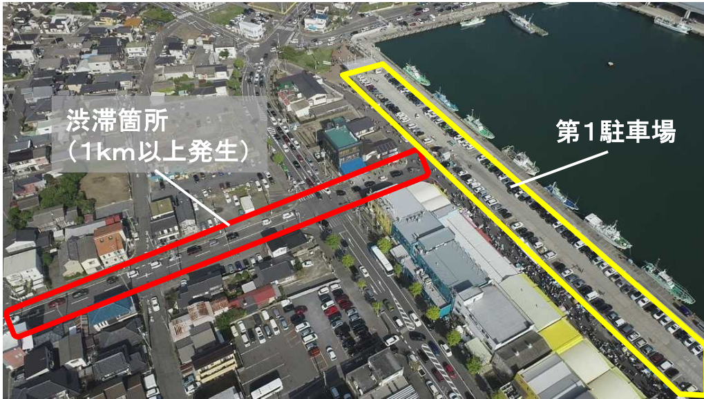
那珂湊おさかな市場周辺の渋滞の様子 (2022年10月撮影) 10月の繁忙期の休日には第1駐車場の満車に伴う入庫待ち渋滞が1km以上発生する。

各報道機関におかれましては、本取組への記事への取り上げ等、ご協力をお願いいたします。