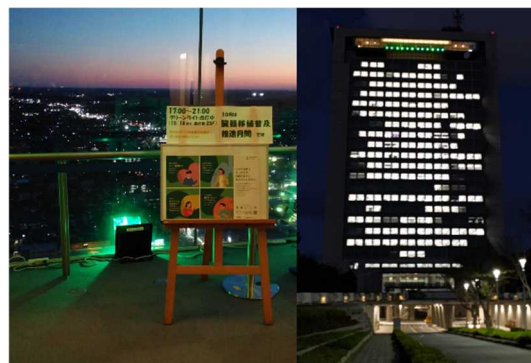
参考：令和5年のライトアップ実施状況 茨城県庁舎25階南側展望ロビー