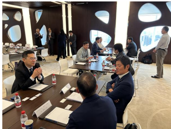
県内企業と中国企業との面談