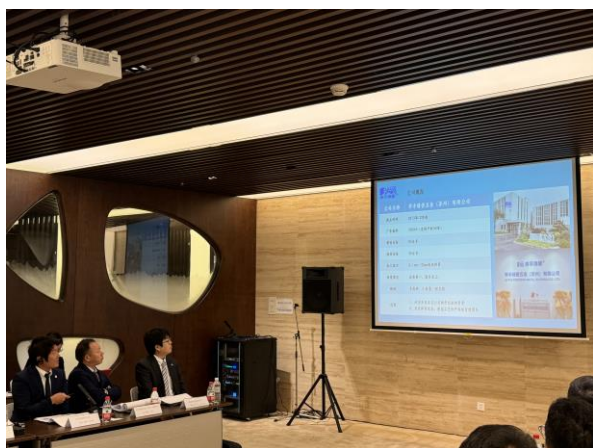
県内事業者によるプレゼンテーション