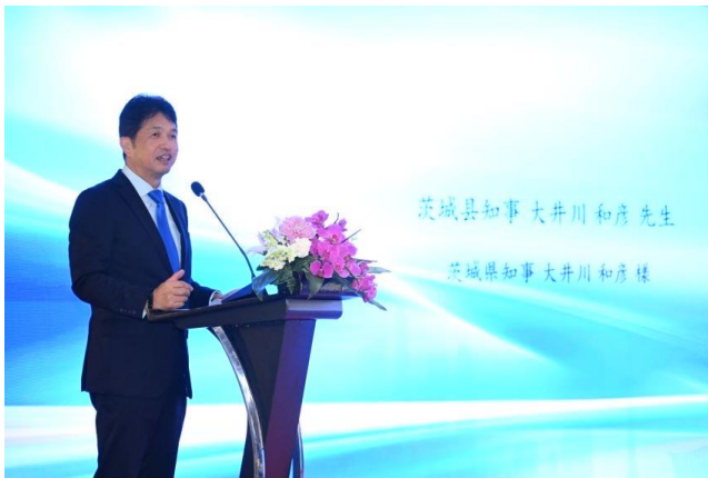
茨城県を積極的に PR する大井川知事