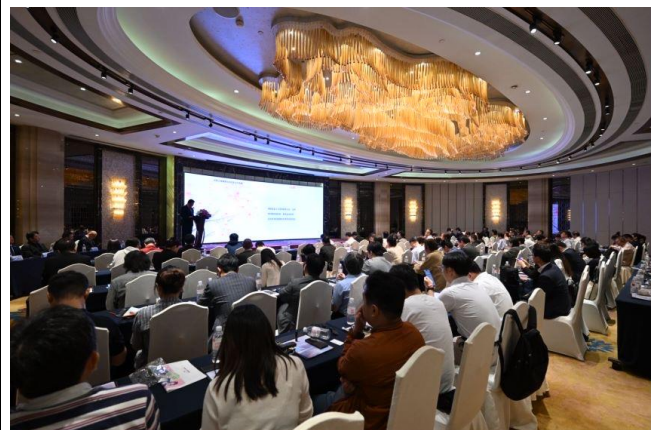
セミナー会場の様子