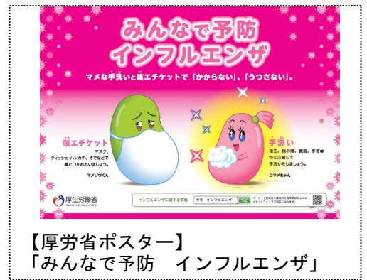
【厚生省ポスター】 「みんなで予防 インフルエンザ」