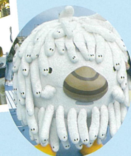
大洗町イメージキャラクター アライッペ

※イベントは、気象状況等により中止する場合があります。 また、イベント等の時間は予告なく変更となる場合があります。 ※イベント中止の際は、大洗港振興協会及び大洗町ホームページにて告知します。