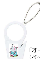
「オープナー」イメージ （ペットボトル等を力を入れずに 開閉できる補助グッズ）