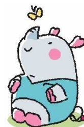
イメージキャラクター「きゅーさいちゃん」

（「救済」と動物の「サイ」を掛け、耳やしっぽの先が「心」をイメージしたハート型、しっぽ全体が「Q」の形になっている。）