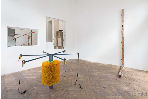
Yvonne インスタレーション、2022

ザイラーは、これまでに、有機的な素材と工業製品によって作られるオブジェによって、人間と動物の関係を問う作品を制作している。作品は、実際に人間や動物に使用されながら、社会文化的に構築された両者の関係を再文脈化する。文献をあたり、現地での調査を踏まえて制作される作品は、理論や学説をなぞる資料的なものではなく、人間とそれを取り巻くアクターの有機的で動的な関係を表象するものとして提示される。彫刻を学んだことで得られた確かな造形力と空間に対する理解力、そこにリサーチによる人間をめぐる新たな関係の探究心が加わることで、彼女の創作活動は近代以後の可能性を照らし出す。