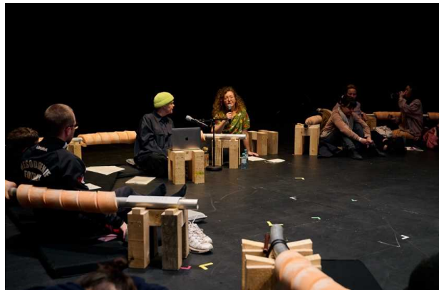
Together the Parts (seat object) インスタレーション、2021