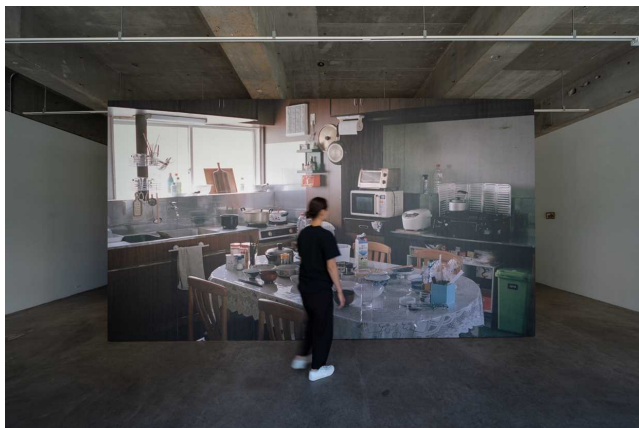
《みおぼえのある風景》 インスタレーション、2023