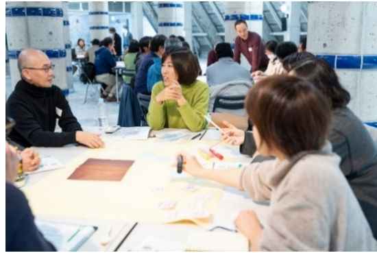
（参考）昨年度の実施風景