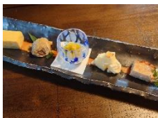
寿昌庵けん坊 (大子町)