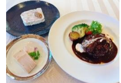
フレンチレストラン MEBUKI (神栖市)