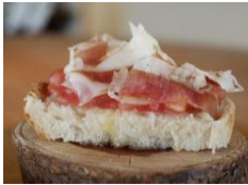
YOSHIKI FUJI (常陸大宮市)