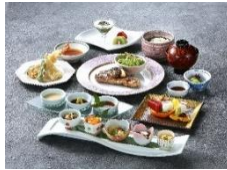
旬彩和膳 よし川 (水戸市)