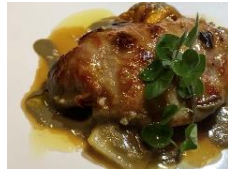
ランテルナ マッサ (水戸市)