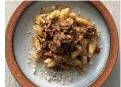
LA CUCIA DEL CUORE MAIS (つくば市)