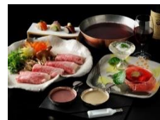
海音別邸 大河の雫 (坂東市)