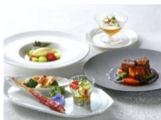
テラスレストラン ・ローズ (水戸市)