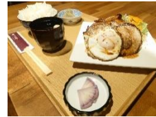
見晴らしの丘 真壁うり坊 (桜川市)