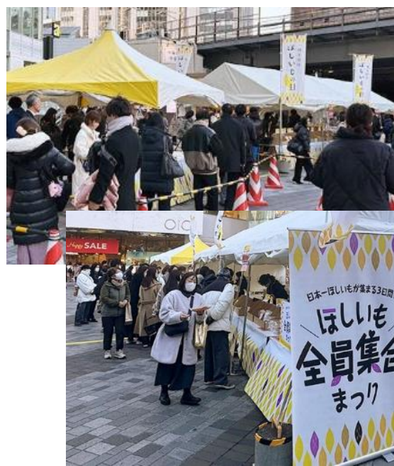
▲ イベント当日の様子

1月9日(木)～11日(土)に、有楽町駅前広場で、茨城県アンテナショップほしいもPRイベント、 日本一ほしいものが集まる3日間！「ほしいも全員集合まつり」 を開催しました。当日は寒い中にもかかわらず、多くのほしいも好きの皆さんにご来場いただき、3日間で3,300人を超える方にご購入いただきました。