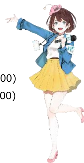
茨城県公認Vtuber 茨ひより