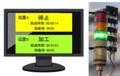
設備稼働状況の見える化