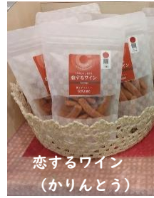
恋するワイン （かりんとう）

ほんのりピンク色で、一口サイ ズ、サクサク軽くて、ワインの風 味が楽しめるかりんとう。甲州 ワインを使用。アルコールを飛 ばしているため、お子様も安心 して召し上がれます