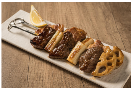
常陸牛 & 常陸の輝きの ステーキ串セット ¥1,800 (税込)