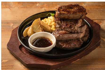
常陸牛スコアリンクステーキ ¥5,500 (税込)