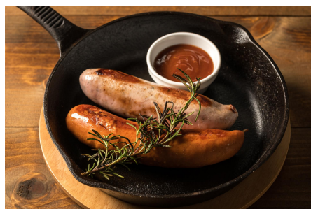
常陸の輝きソーセージ ¥800 (税込)