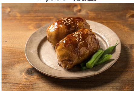
常陸の輝き 肉巻きおにぎり ¥800 (税込)