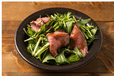
常陸牛ローストビーフ ¥1,500 (税込)