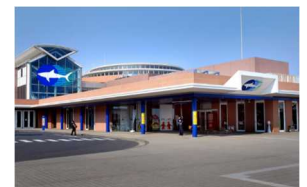
アクアワールド・大洗