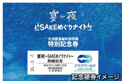
▲アクアワールド・大洗の名前が記載された記念硬券は初発行です

また、当該記念硬券をアクアワールド・大洗の入場口のブースで提示いただくと、オリジナルグラスを配布いたします。（いずれも、先着200名限定。非売品。配布時間は16:30から18:45まで。）