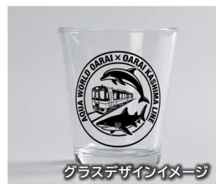
▲オリジナルグラスは、今回イベント向けに制作した特別なグッズです