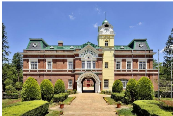
▲国指定重要文化財の牛久シャトー本館