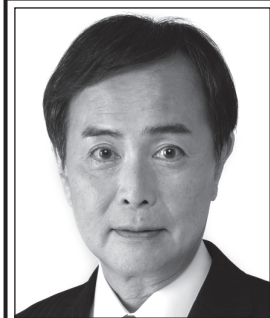
かわい たかのり 国民民主党 参議院国会対策委員長 ムダにしません 汗と税!