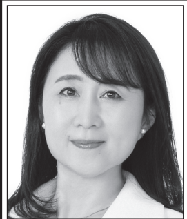
やた わか子 国民民主党 副代表 あなたと動けば、 未来は変わる。