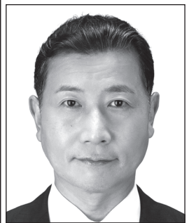
たいじ りょうへい 元衆議院議員 表現の自由を守る・ 日本V字回復やったるい