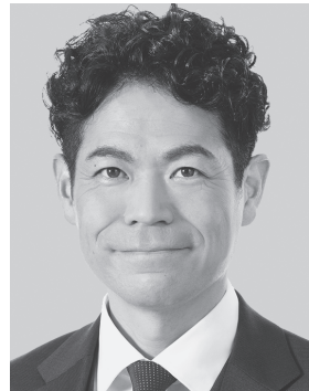
たけだ 良介 1979年生まれ。 参議院議員1期、 党中央委員