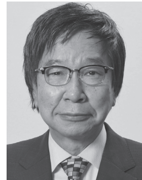
大門 みきし 1956年生まれ。 参議院議員4期、 党中央委員