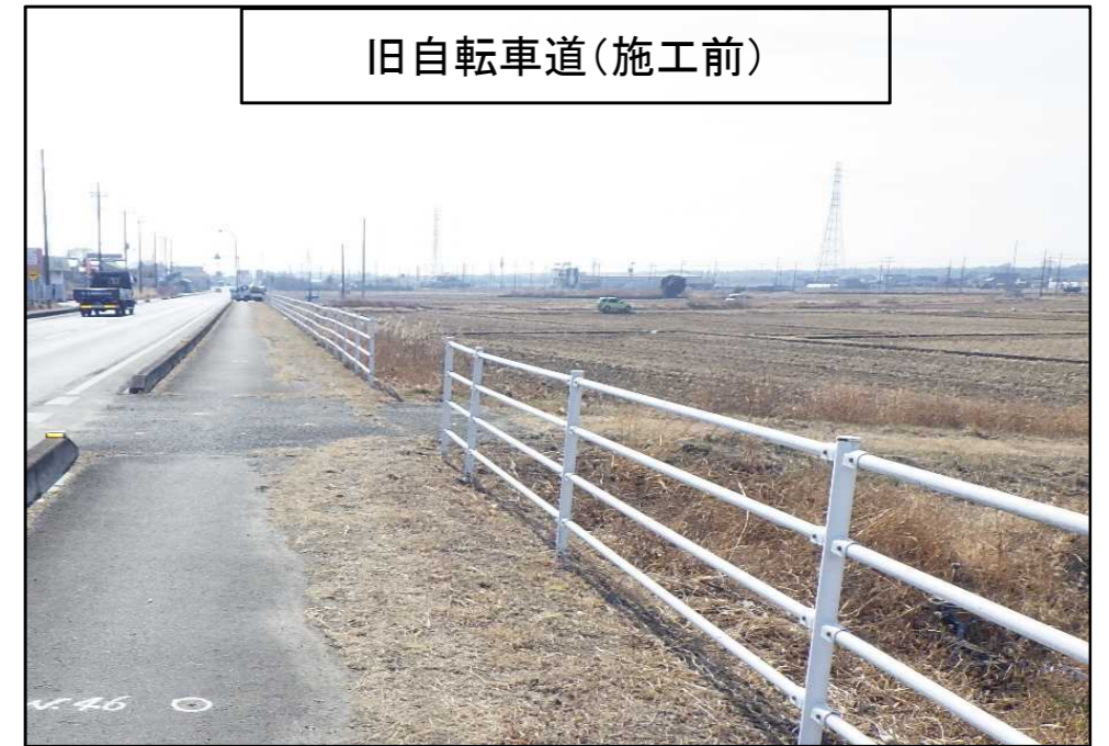
旧自転車道(施工前)