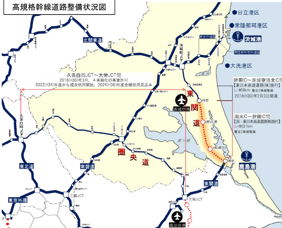
高規格幹線道路整備状況図