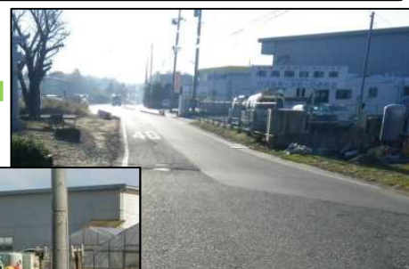
館野牛久線 (つくば市南中妻)