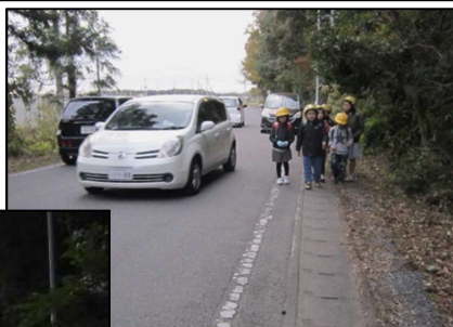
菅谷小原内水戸線 (那珂市後台)