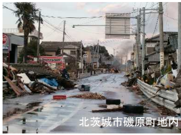
国道6号の浸水状況