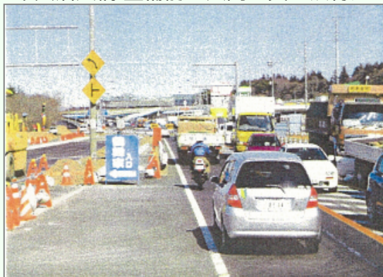
牛久沼大橋 整備前 八間堰交差点付近