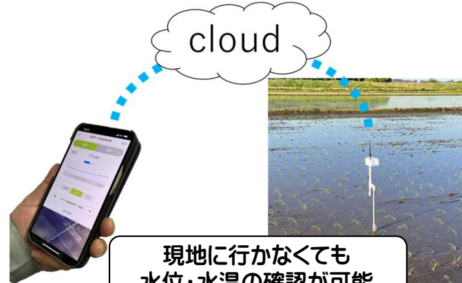
現地に行かなくても 水位・水温の確認が可能 遠隔監視による水管理労力の削減