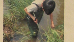
図18 川に入っている写真