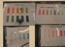
図12 6月5日のデータの集計