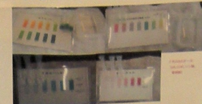
図14 7月2日の調査結果

7月2日のCODなどの数値の値が高かったわけの考察としては、その日の午前中に雨が降ったことで、河川の水量が増え、川岸の土が浸食されることで川の水が汚くなったのではないかと考えた。