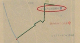
図1 学校から水の採取位置 緑の線 移動ルート 赤の点 水の採取位置