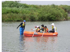
Cooperation with and Support for citizens' activities