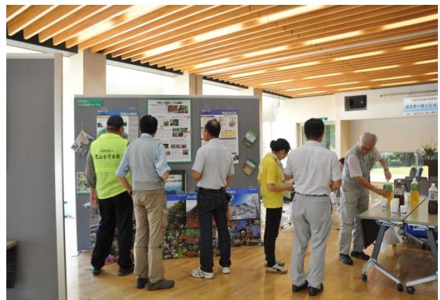
交流ひろばの様子