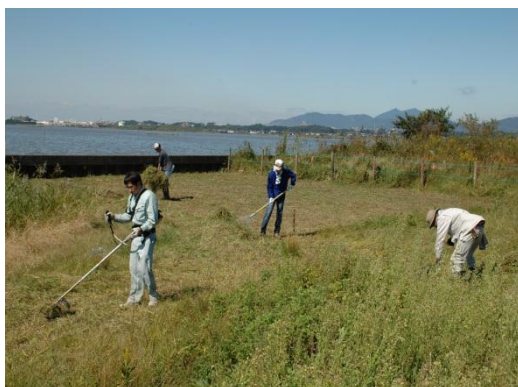
機材を利用した水辺保全活動