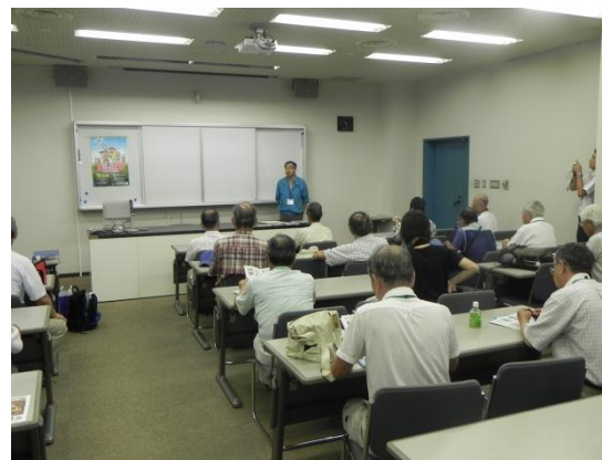
パートナー研修会