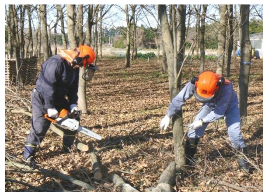
機材を利用した里山保全活動