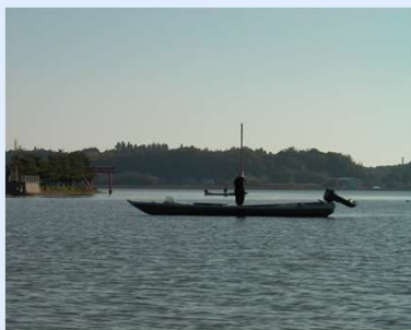
涸沼でのシジミ漁の様子

涸沼は、涸沼川などの河川水が流入するとともに、満潮時には那珂川、涸沼川から海水が遡上する関東唯一の汽水湖で、2015年にはラムサール条約の湿地に登録されています。平均水深2.1m、湖面積9.4km 2 の浅く小さな湖沼で、ヤマトシジミなどの漁場であるとともに、ヒメマイトンボなど希少動植物が生息しています。