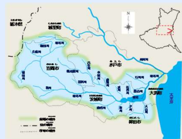
涸沼の位置と概略図