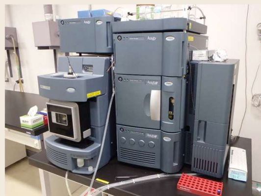
液体クロマトグラフ質量分析計 (有機ヒ素等)

また、硝酸性窒素濃度が高かった場合は、硫酸イオンなどの陰イオン成分やカルシウムイオンなどの陽イオン成分も測定しています。