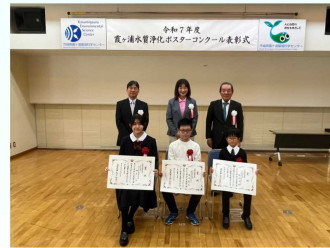
昨年度の表彰式の様子