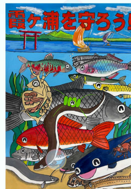
小学校高学年部門