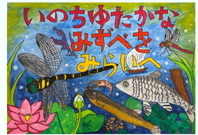
小学校低学年部門