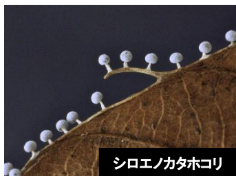
シロエノカタホコリ