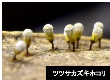
ツツサカズキホコリ