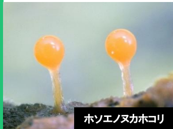
ホソエノヌカホコリ

変形菌を対象とする自然観察会は、センターでは初めての開催となります。講師の解説を聞きながら、探して、見つけて、その姿をじっくりと観察してみましょ。そのカラフルで妖精のようなかわいらしい姿に、森を見る目も変わるかもしれません。