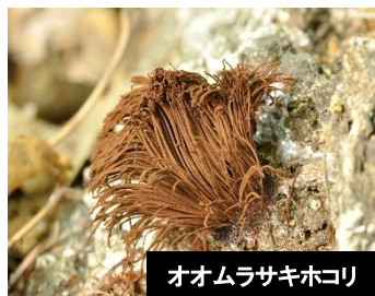
オオムラサキホコリ