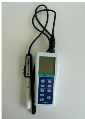
04 電気伝導率計(ECメーター)