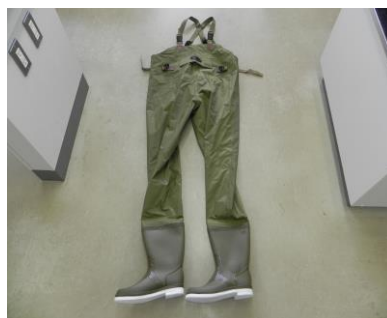
25 ウェーダー(胸当て付き胴長)