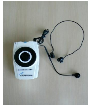
17 ハンズフリー拡声器