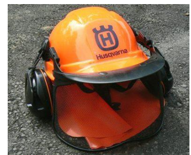
13 ヘルメット(イヤーマフ付き)