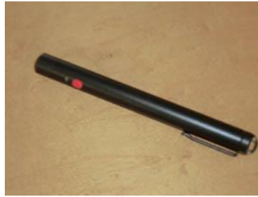
26 レーザーポインター