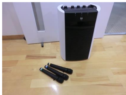
32 ワイヤレスアンプマイクセット