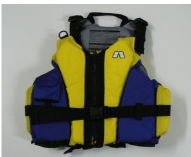
24 ライフジャケット