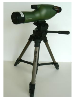
10 フィールドスコープ