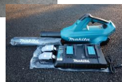
28 ブロア(エンジン背負式 ) ブロア(充電式・ハンディ)