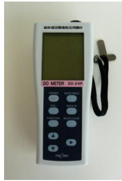
14 溶存酸素計(DOメーター)