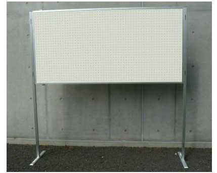
15 有孔パネルボード