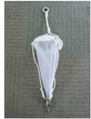
03 小型プランクトンネット