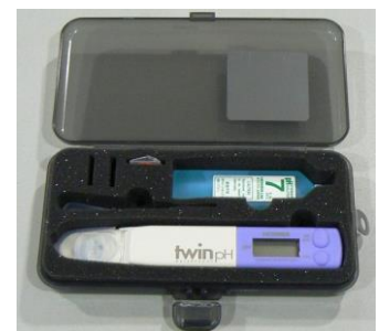
24 コンパクトpHメーター