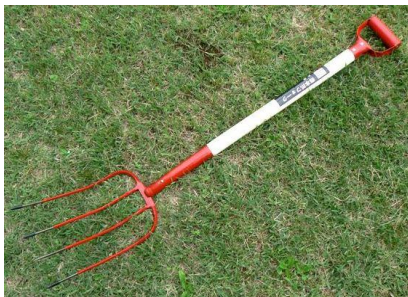
18 木柄4本爪フォーク