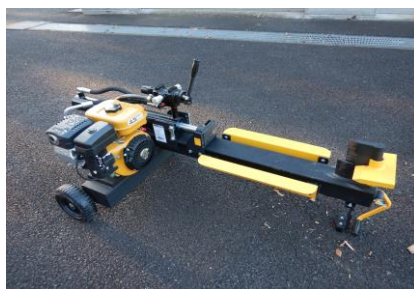
30 エンジン式薪割り機