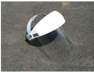
04 フェイスシールド