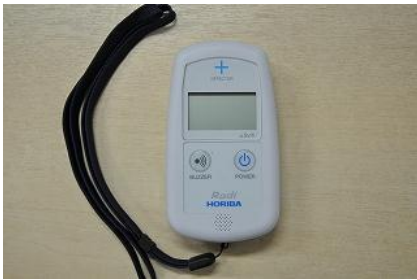
28 環境放射線モニター