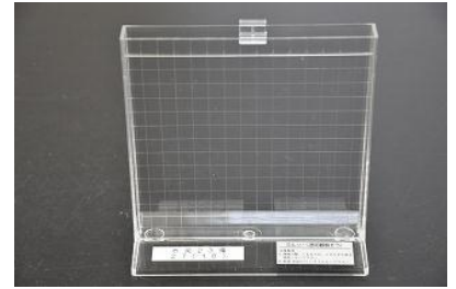
27 観察用水槽(ミルソー)