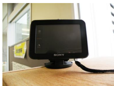
23 ポータブルナビゲーションシステム