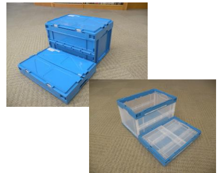
30 折り畳み式コンテナ (ふた付・ふたなし)