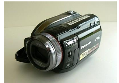
18 デジタルビデオカメラ