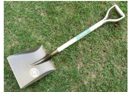
17 アルミ柄ショベル