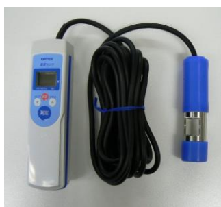
22 ポータブル濁度計