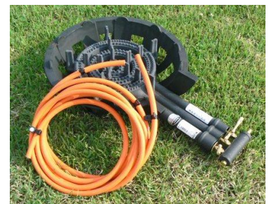
23 プロパンガスコンロ