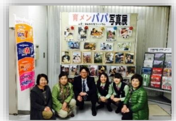
育メンパパ写真展（市内銀行）