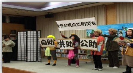
朗読劇平成版ももたろう〈防災編〉