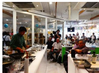
(ライブキッチンの様子)

令和元年9月14日土曜日に、土浦市男女共同参画センターフェスティバルを開催。その中で、男性の家事参画を促進するため、内閣府が実施している料理に不慣れな人でも、手軽に作れる「おとう飯」レシピを一般に公募し一次審査で選定された方々に実際に調理をしてもらいました。