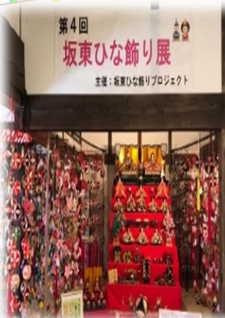
坂東ひな飾りプロジェクト

また、こども達と高齢者の貧困問題など、坂東市民へ身近な問題を提起し、女性の視点を活かすよりよい市民生活を推進するため、会員一同活動してまいります。