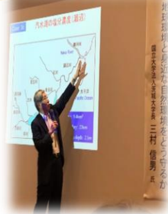
環境問題のいきいきセミナー

併せて、「女性と防災の報告書」の刊行や「女性と防災提言会」も開催しました。その提言内容の一つは男女の役割を固定しない自主防災組織づくりと女性の視点を活かす避難所運営をすること、また、ジェンダーにとらわれずリーダーシップが取れる女性が必要であり、様々な審議会や意思決定の場に女性を参画させることの重要性を強調しています。