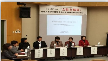
女性と防災シンポジウム