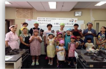
いきいきセミナー・パパと料理