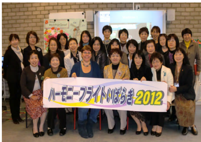
ヨハン・ウエストシュタイン小学校にて

30年前は個人が自由に海外へ出かける事ができる時代ではありませんでした。ましてや、職業を持たない女性にとっては夢のような事であったと思います。この研修は、日本を離れて見聞を広めると同時に外から日本を再認識するという絶好の機会をくださいました。