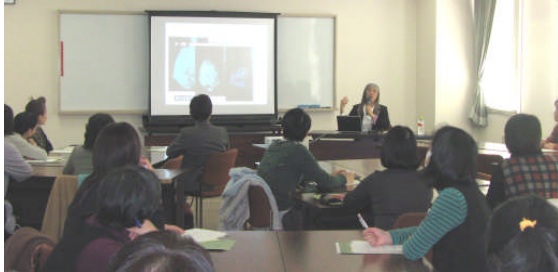
✂ 乳ガン触診方法指導中の様子