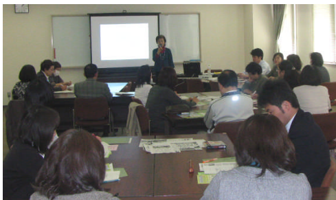
✂ ワークショップの様子