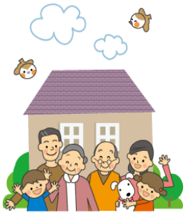
図14 「夫は外で働き、妻は家庭を守るべきである」という考え方について