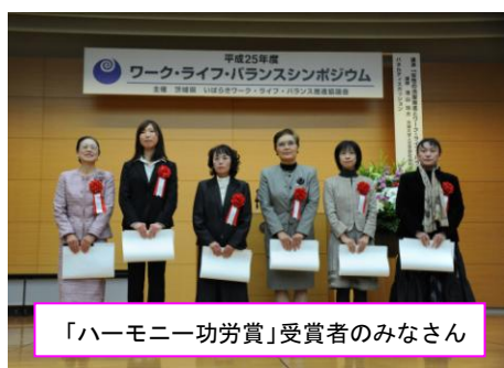
「ハーモニー功労賞」受賞者のみなさん

併せて、男女共同参画の推進に功績のあった個人・団体・事業所を表彰する「ハーモニー功労賞」の表彰式を行いました。