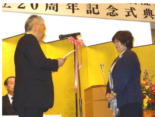
沼田会長から初代宇都宮会長に 永年会員の証書を授与