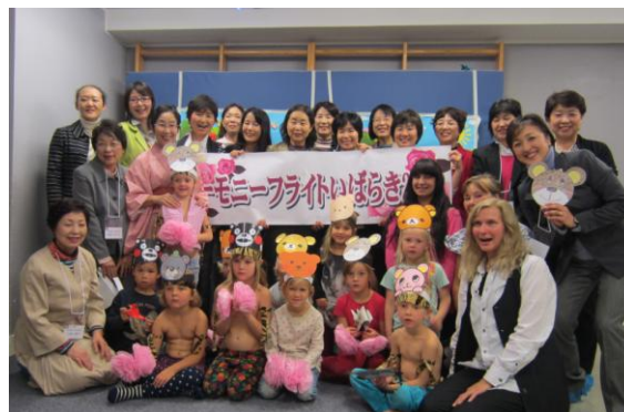
プレスクール・タッパンにて子どもたちと