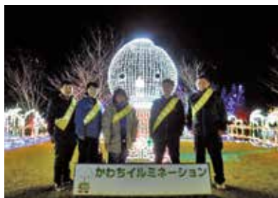
かわちイルミネーション巡回パトロールの様子

河内町の長竿地区で実施している『かわちイルミネーション』開催期間に、毎年巡回パトロールを実施しています。町内のイベントということもあり、青少年が犯罪に巻きこまれないように抑止力としての効果を十分に発揮しています。