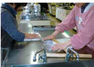
更生施設訪問事業の様子

明日の河内町を担う青少年が健やかにたくましく成長し、自立・活躍できる社会を実現することは、すべての相談員の願いです。