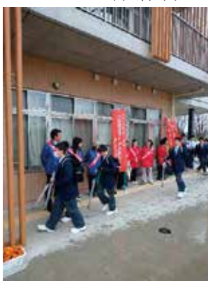
あいさつ声かけ運動の様子

児童、生徒が夏休みのこの期間は、非行への誘惑や危険が多い季節と考えられます。そこで青少年の非行及び事故防止の観点から夜間にコンビニエンスストアなど青少年と関わり深い店舗に夏期街頭パトロールを行っております。