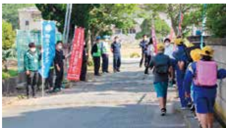
あいさつ運動の様子

時代に沿った知識を得る為には、各種研修会に参加して、未来を担う青少年・子供達の育成活動並び地域の信頼の厚い青少年相談員として取り組んで参りたいと考えます。