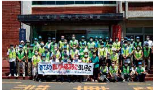
社会環境整備事業

潮来市内小学校5校、中学校4校、高等学校1校の教職員の方々と、各地区から選出された66名と合せて、76名の青少年相談員の皆さん達と青少年と子供達の日常の安全を守る活動をしてまいります。今年度・昨年度は新型コロナウイルス感染症拡大防止のため、市内各地区の祭礼、水郷潮来花火大会等のイベントが中止となり、それに伴い巡視活動が中止となるなど、多くの活動が中止となっております。その様な状況の中、感染防止対策を考慮して、実施している活動をいくつかご紹介します。