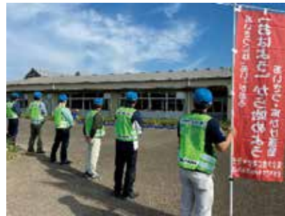
あいさつ運動の様子

域の情報は、非行防止活動の一旦として、学校・警察を含め各団体と共有して活動をしてまいります。また、今後も店舗訪問を行い情報収集に努めると共に、新規店舗を開拓し、より広くカバーできるように努めて参ります。