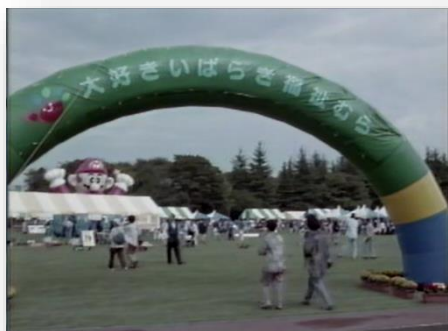
大好きいばらき 福祉むら