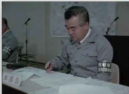
茨城県災害対策本部長 橋本昌県知事