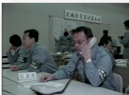
防災訓練に臨む県職員