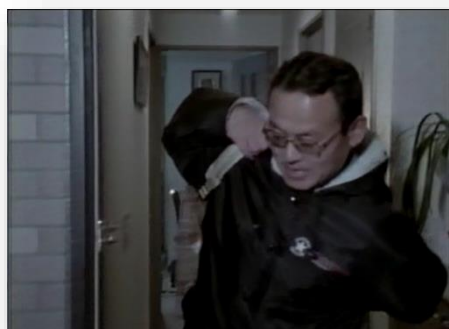
防災訓練に向かう県職員

・平成9年1月17日、茨城県庁で防災対策訓練が行われた。災害対策本部の設置、防災ヘリコプター「つくば」の出動。三の丸庁舎空撮。 1997/1/17 水戸市ほか