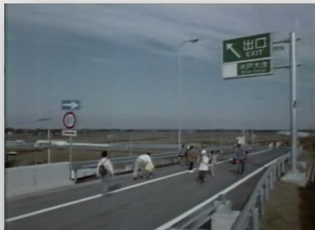
東水戸道路を歩く