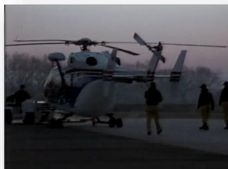
防災ヘリコプター「つくば」