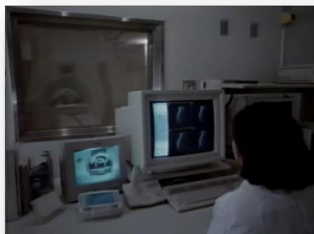
茨城県立医療大学付属病院MRI